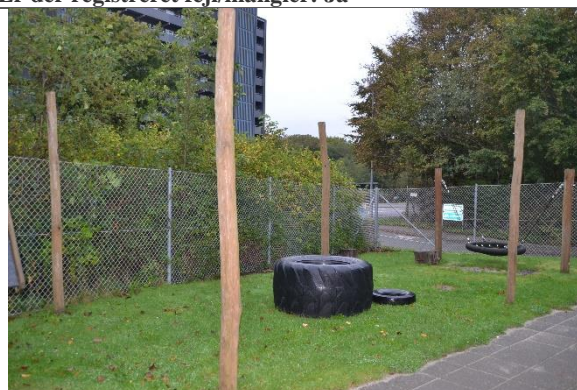
Redskab: Stolper til læsejl Årgang: Producent: Er redskabet mærket: Nej Er der registreret fejl/mangler: Nej