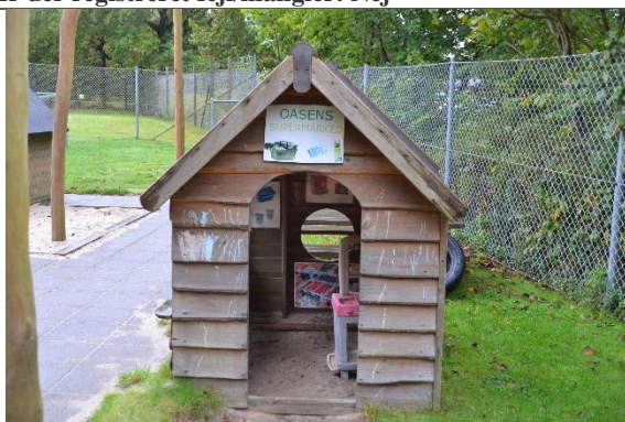
Redskab: Legehus Årgang: 2014 Producent: Rejstrup Savværk Er redskabet mærket: Ja Er der registreret fejl/mangler: Nej