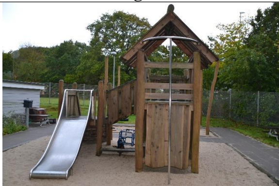
Redskab: Klatrestativ med rutsjebane Årgang: Leika Producent: 2014 Er redskabet mærket: Ja Er der registreret fejl/mangler: Nej