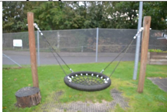
Redskab: Fugleredegynge Årgang: 2015 Producent: Leika Er redskabet mærket: Ja Er der registreret fejl/mangler: Ja