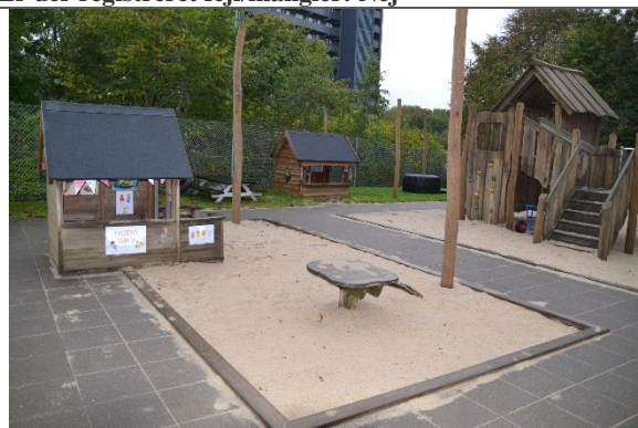
Redskab: Sandkasse med stolper til læsejl Årgang: Producent: Er redskabet mærket: Nej Er der registreret fejl/mangler: Nej