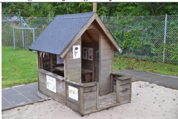
Redskab: Legehus Årgang: 2014 Producent: Leika Er redskabet mærket: Ja Er der registreret fejl/mangler: Ja